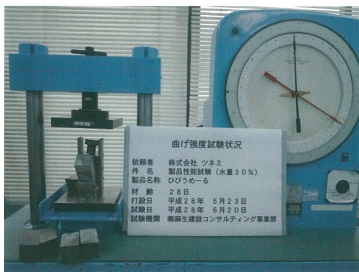
写真-1 曲げ強度試験状況